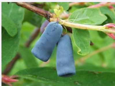
Owoce jagody kamczackiej (Wiciokrzew siny).

Jagoda kamczacka to roślina, która dopiero od niedawna jest uprawiana w Polsce i jestem bardzo ciekaw jak smakuje. Kiedy więc zobaczyłem ją w sklepie ogrodniczym od razu zdecydowałem się ją kupić. Dumny przywiozłem ją do domu i kiedy zjrzałem do informacji na temat uprawy mina mi trochę zrzędła, albowiem okazało się, że do tego, aby dobrze owocowała trzeba posadzić obok siebie co najmniej dwie odmiany. No tak... Tylko skąd mam wiedzieć, którą odmianę kupiłem? To akurat nie jest napisane. Wyczytałem na forum, że odmiany można rozpoznać po liściach - jedne są węższe od drugich. Wszystko super, tylko na razie ta jagoda to same patyki.